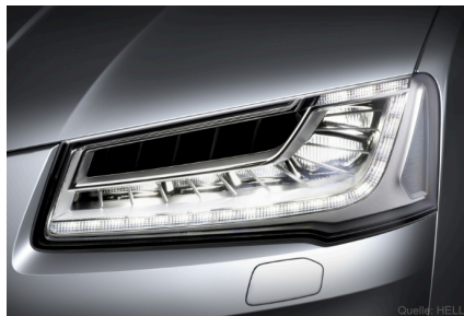
Matrix LED-Scheinwerfer von HELLA