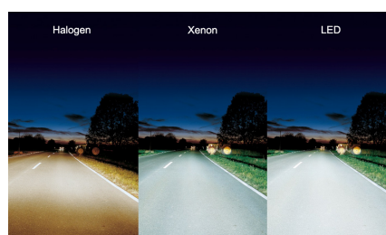
Beispiel für Halogen-, Xenon- und LED-Beleuchtung