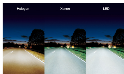
Beispiel für Halogen-, Xenon- und LED-Beleuchtung